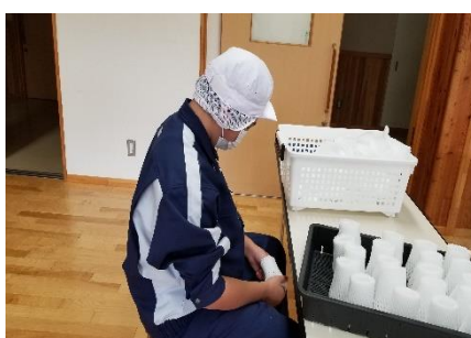
〔商工会委託作業（シール貼り作業）〕