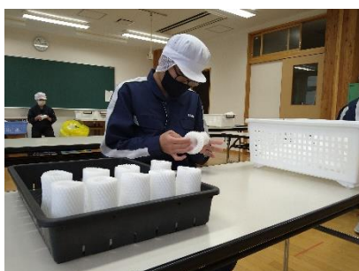
〔丸三化成稲川工場（ポリパックの結束作業）〕